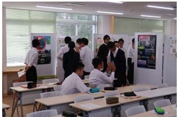
写真2 『COC+地理』グループ発表風景