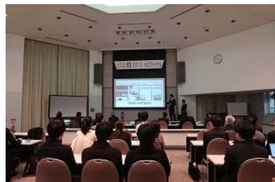
写真2 『ビジコン奈良 2019 セミファイナル』における本校学生の発表風景