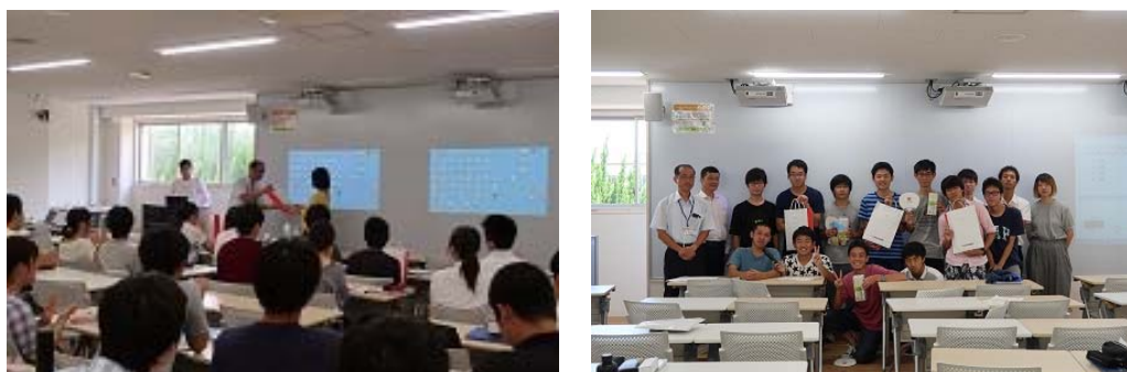
写真 10 評価発表風景及び記念写真