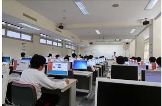
写真1 『COC+地理』授業風景