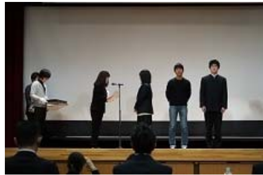
写真1 「第2回 高校生ビジネス・グランプリ in 斑鳩」 本校学生プレゼンと表彰式風景