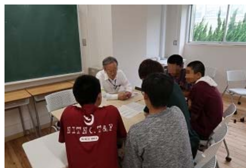
写真 7 株式会社品川工業所による特別講義、アドバイスの風景