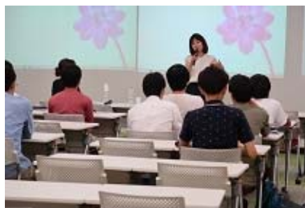
写真 13 講評の風景