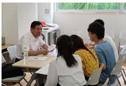
写真 5 奈良精工株式会社による特別講義、アドバイスの風景