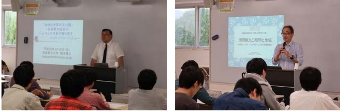
写真18 左：増本特任准教授による講義風景、右：中谷教授による講義風景

平成30年6月6日(水)には奈良県立大学 中谷 哲弥教授による「国際観光の展開と地域ー奈良とインド・バングラデシュにおける農村観光ー」と題し講義が行われた。観光という視点から地域(奈良)と世界の文化についてアプローチしていき、観光のなかに、いかに文化(=生活文化)が組み込まれ、観光資源化されているのかを奈良とインド・バングラデシュにおける農業体験や農家民宿などの農村観光(グリーン・ツーリズム)を中心に、奈良県立大学の学生が体験したスタディツアーやエコツーリズム等の事例の紹介があった。