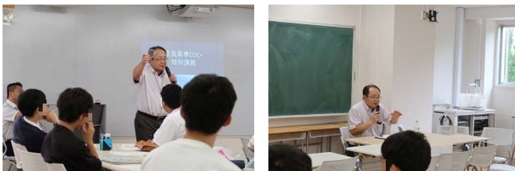
写真 8 広陵化学工業株式会社による特別講義、アドバイスの風景