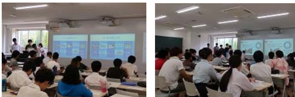
写真 9 最終発表風景