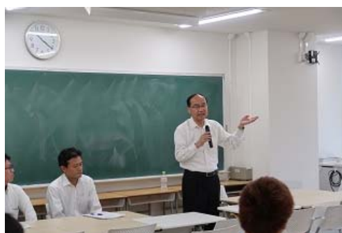
写真 6 奈良OAシステム株式会社による特別講義、アドバイスの風景