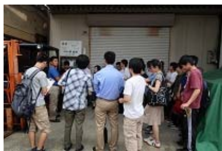
写真 12 斑鳩町フィールドワークの風景