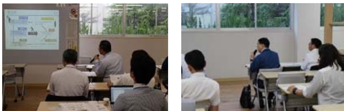
写真 16 企業からの質疑応答風景