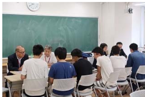
写真 4 フルックスグループによる特別講義、アドバイスの風景