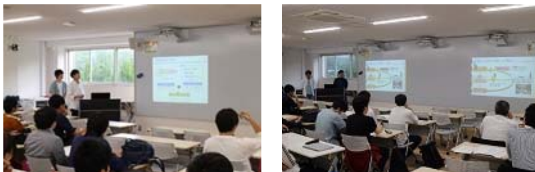
写真 15 学生による発表風景

中間発表では、各企業出席のもと、各チームが企業から提供のあったテーマに対し、工場見学で実際に見聞きした情報や関連技術文献調査などを基に、ロジックツリーやペイオフマトリックスなどの手法を用いて問題点と課題を整理し、解決策の検討状況を発表した。各チームの発表に対して出席の企業から率直な意見・感想をいただき、今後の解決策検討の方向性が示された。