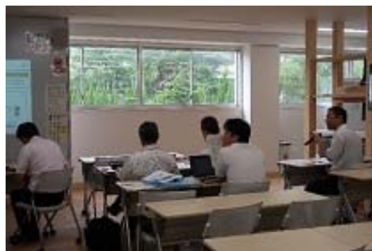
写真 17 左：学生による発表風景、右：出席者による質疑応答風景