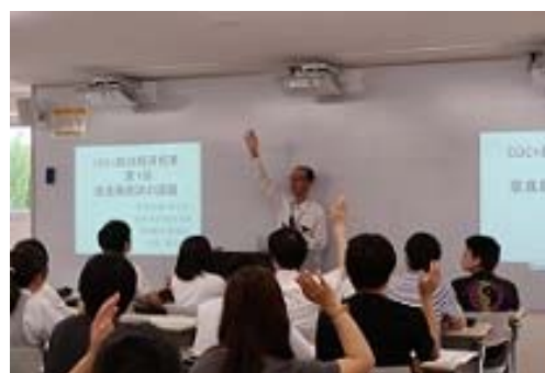
写真3 奈良中央信用金庫による特別講義の風景