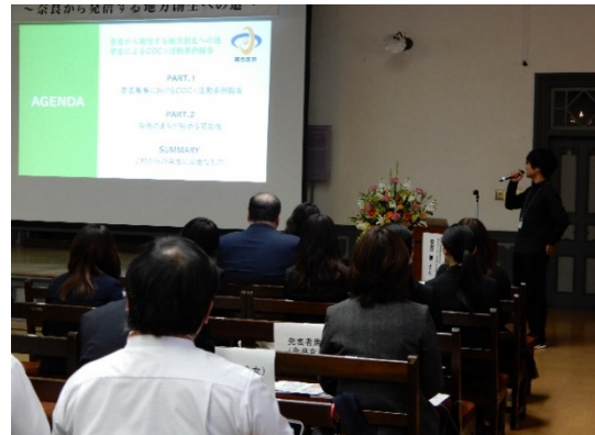
奈良工業高等専門学校学生による発表