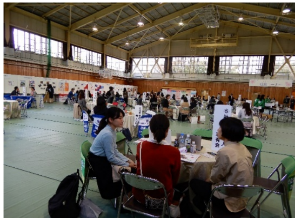
女子大学生ワーク&ライフEXPOのチラシと会場の様子