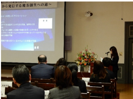
奈良女子大学学生による発表（2）