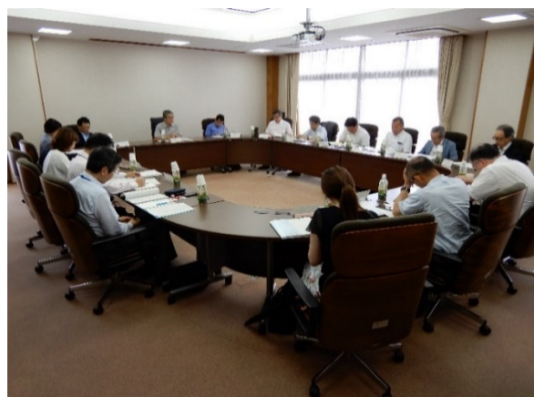
COC+評価委員会の様子