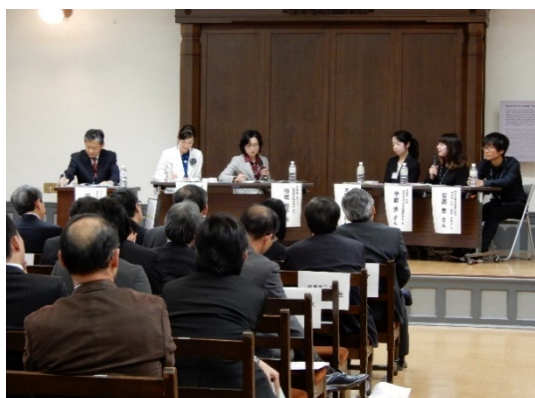
パネルディスカッションの様子(2)