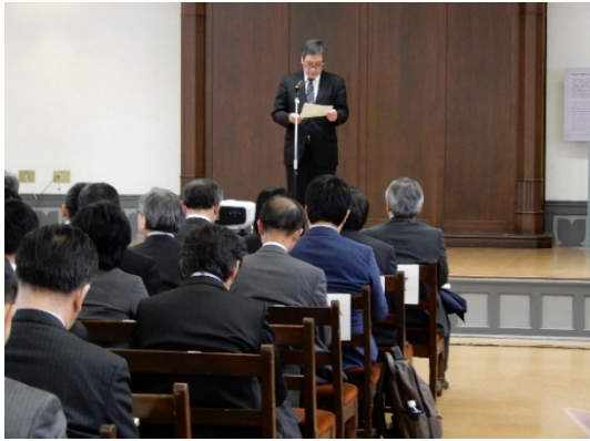
奈良女子大学 今岡春樹学長挨拶