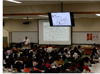
奈良県立大 増本先生 10.9