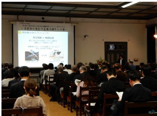
奈良女子大学学生による発表(4)