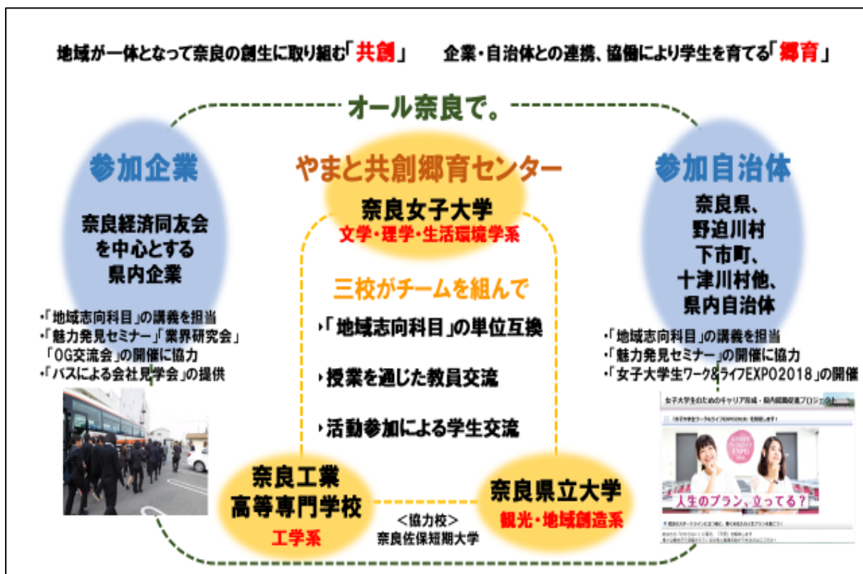
「共創郷育：やまと再構築プロジェクト」概要

COC+3校は、教育・研究資源を活かした授業科目を学生に提供し、さらに、単位互換制度や、各校が開講する授業科目への教員の相互派遣を通じて、それぞれの強みを共有している。地域とのつながりを強くした教育プログラムを通じて学生の視野を広げ、興味や関心を触発することによって、地方創生に対する多面的な思考力と行動力を高め、多様な地域人材を輩出し、一人でも多くの学生が奈良県に就職することを目指している。