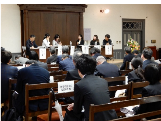
パネルディスカッションの様子(3)