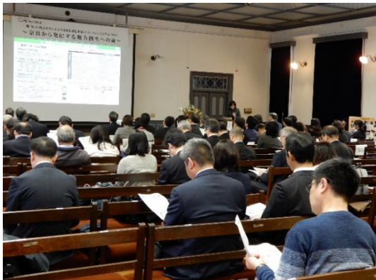
平成 30 年度事業成果報告