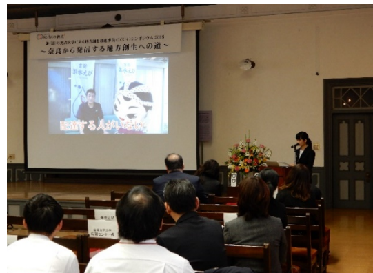
奈良女子大学学生による発表（3）