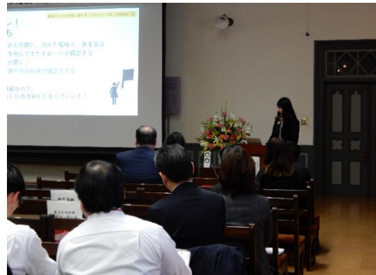
奈良女子大学学生による発表（1）