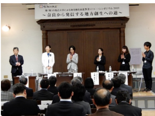
パネルディスカッションの様子(1)