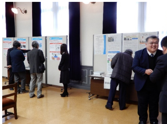
COC+3校のポスターセッションの様子(1)