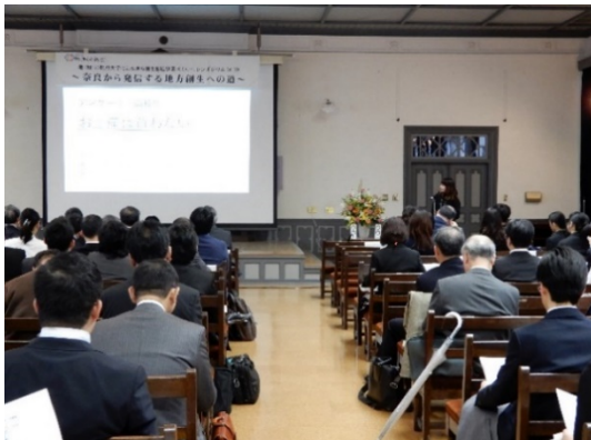
奈良県立大学学生による発表