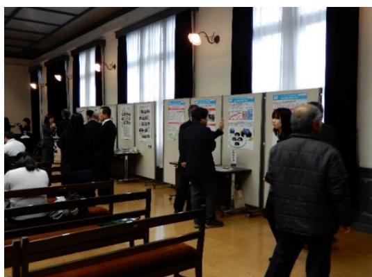
COC+3校のポスターセッションの様子(2)