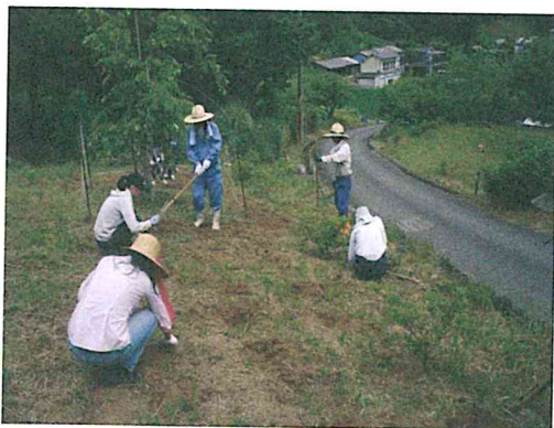
図1 大字谷瀬での植栽

あわせて大学生と地域住民の交流が図られることで、地域住民のいきいきとした表情を見ることができた。