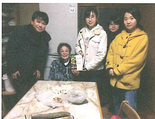
ライフヒストリー フォトブック等贈呈（集落点検結果報告）