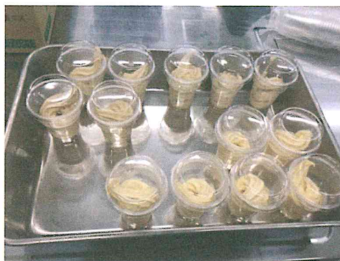
ソフトクリームの改良（奈良県農業研究開発センター）