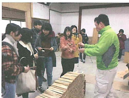
現地実習（撮影・割箸インタビュー）