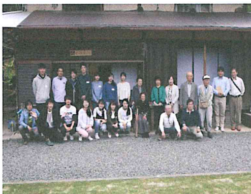
集落点検参加者集合写真