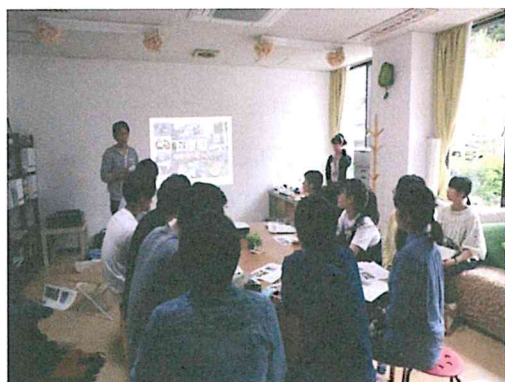
下市町を知る（アクティビティーセンター）

下市町の地域コミュニティの課題について知識を深め、コミュニケーションやプレゼンテーションスキルの向上を図る目的で、下市町の各所を訪問し地域住民と交流しながら地域ムラ資源点検インタビュー（集落点検）を奈良工業高等専門学校と合同で実施。学生が下市町で活動しながら地域コミュニティの課題等を知ると共に、集落点検のインタビューの結果を一人ずつフォトブックにまとめ配布頂くといった形に残る成果があり、地域の元気にも繋がった。