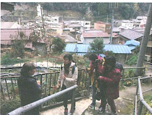
現地実習（撮影・住民インタビュー）