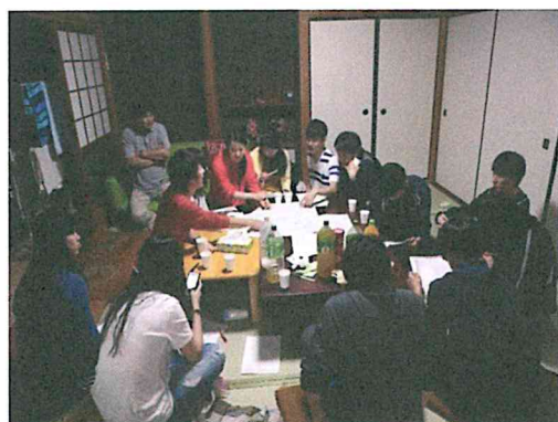
集落点検（ムラ資源点検）データ整理