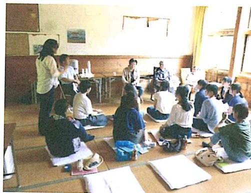
図2 大字内原でのヒアリング