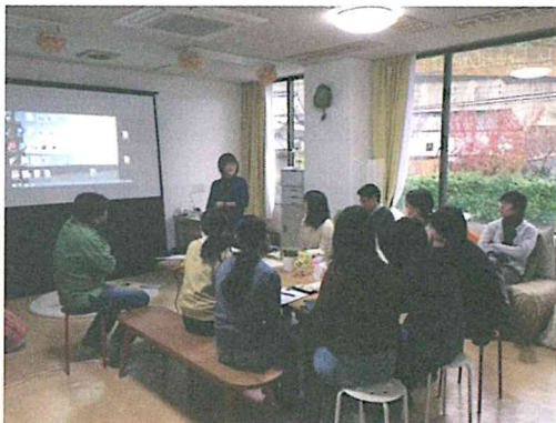
ファシリテーション（アクティビティセンター） ※下市町の女性がファシリテーター

下市町の地域コミュニティの課題について知識を深め、コミュニケーションやプレゼンテーションスキルの向上を図る目的で、昨年度の授業で作成等を行った観光ビデオクリップの更新、ご当地ソフトクリームの改良を行った。下市町の多様な住民との連携・交流と共に、行政機関や企業との連携にも繋がった。