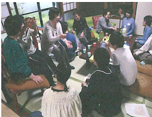
集落点検（ムラ資源点検）