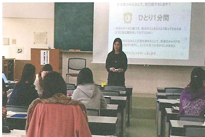
図4 キャリア形成講座