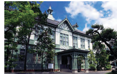
記念館(重要文化財) Memorial Hall (Important Cultural Property)