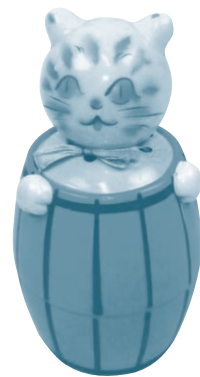
ビクリ猫 (昭和14年3月購入)