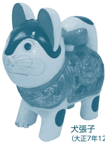
犬張子 (大正7年12月購入)