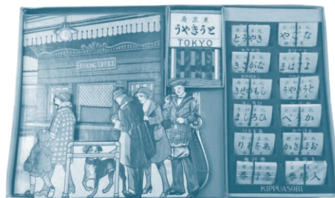
汽車遊ビ (昭和9年5月購入)