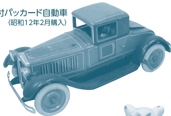
ライト付パッカー自動車 (昭和12年2月購入)