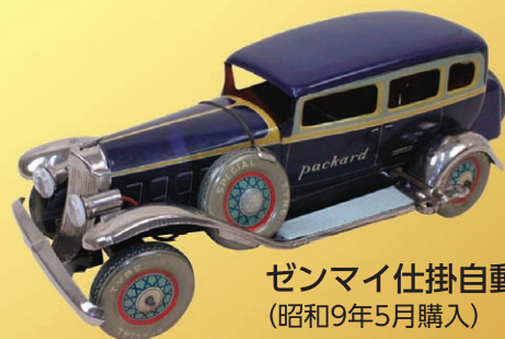
ゼンマイ仕掛自動車 (昭和9年5月購入)