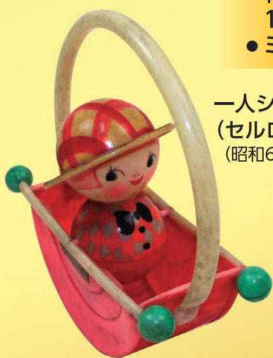
一人シーソー (セルロイド製) (昭和6年3月購入)