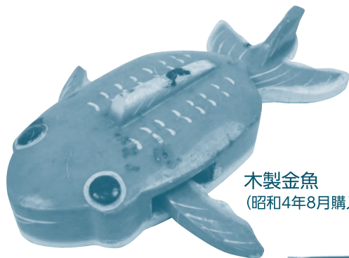
木製金魚 (昭和4年8月購入)