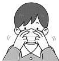
② 顔(鼻)の形に合わせる