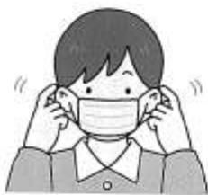
① ヒモを両方の耳にかける