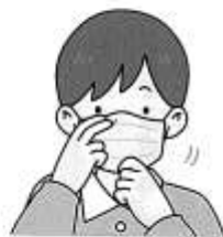
③ マスクを あごまでのばして 鼻と口をきちんとおおう