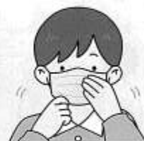
外側をさわってしまう